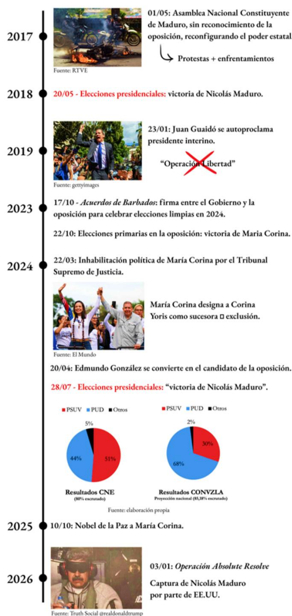
Figura 1: Timeline de los hitos para entender la situación actual de Venezuela.